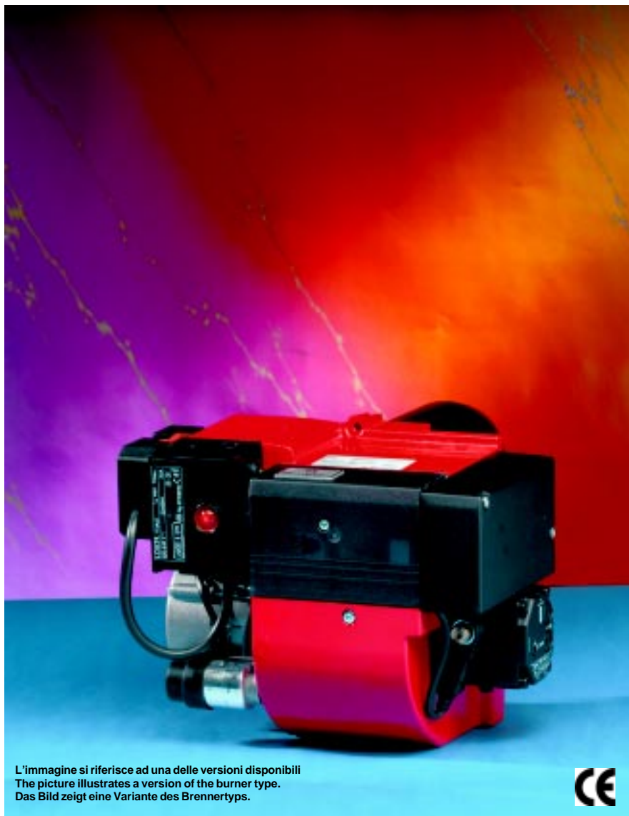
L'immagine si riferisce ad una delle versioni disponibili The picture illustrates a version of the burner type. Das Bild zeigt eine Variante des Brennertyps.